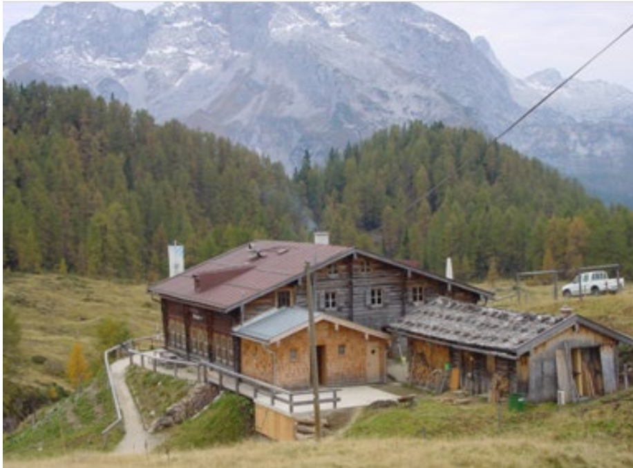
Abb. 1: Berghütte in abge- schiedener Lage

Ein uneingeschränkter Zugang zu sicherem Trinkwasser ist in Deutschland durch die zentrale öffentliche Wasserversorgung jederzeit gewährleistet. Gesichert wird dies insbesondere durch geschützte Rohwasserressourcen, ausgereifte Technik, fachkundige Wasserversorgungsunternehmen und nicht zuletzt durch engmaschige Kontrollen der Wasserqualität. Generell bedeutet ein Anschluss an die zentrale Trinkwasserversorgung für den Verbraucher eine hohe Versorgungssicherheit.